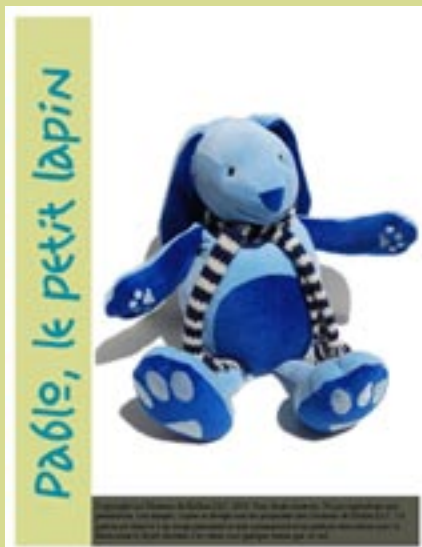
Kit couture Lapin Pablo

RETRouVEZ-LES sur www.kallou.fr ou sur Etsy.com/shop/moutonskallou