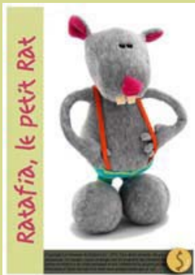
Kit couture Ratafia

LES AUTRES PATRONS ET KITS DE COUTURE DES MOUTONS DE KALLOU